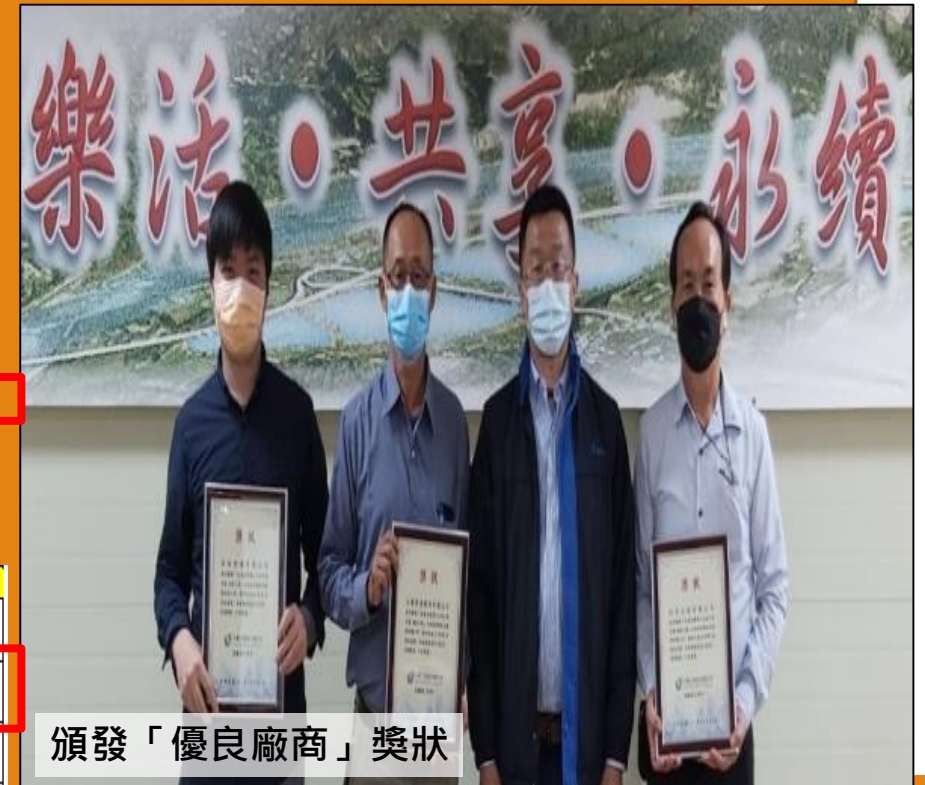
頒發「優良廠商」獎狀